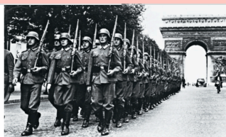
Le Livre Scolaire 3°, 2021, p. 114