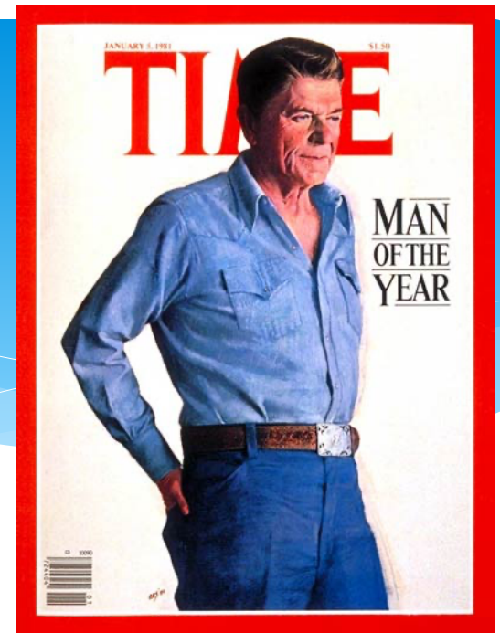
Couverture du Time, magazine américain, 1 er janvier 1981.

« Dans la crise actuelle, l'État n'est pas la solution à notre problème ; l'État est le problème ». (Reagan 20 janvier 1981)