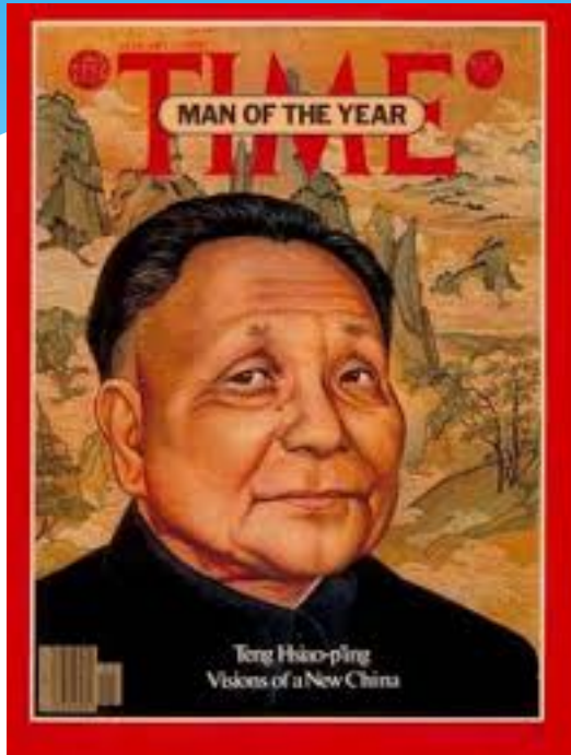
Couverture du Time, magazine américain, 1 er janvier 1979.

« Peu importe qu'un chat soit blanc ou noir, pourvu qu'il attrape la souris ! » Deng Xiaoping.