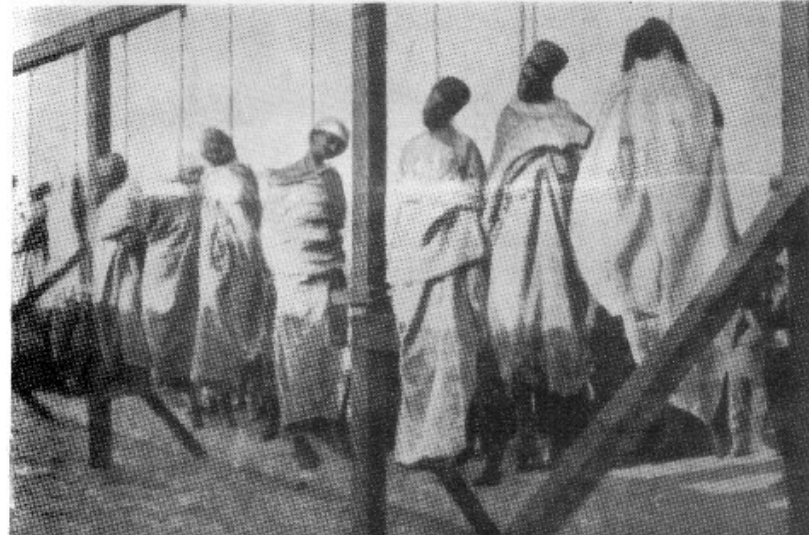
Impiccagione di arabi dopo i fatti di Sciara Sciat.